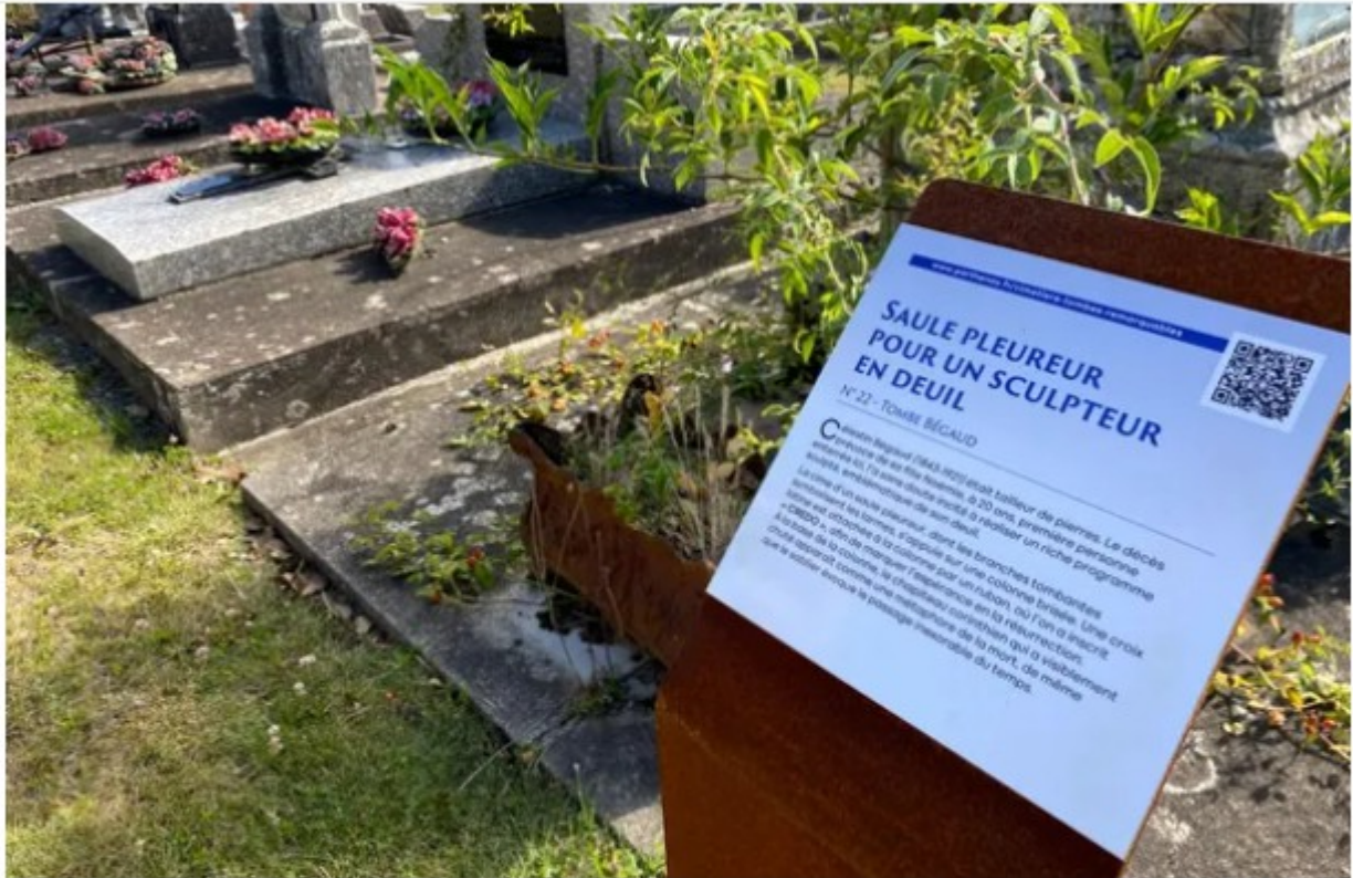
Des panneaux avec un QR code permettent d'en apprendre plus sur l'histoire de ces tombes remarquables.

Sur les panneaux, des QR codes donnent accès à des photos, des informations supplémentaires. Des brochures avec un plan doivent être bientôt éditées. La Ville a aussi pour projet d'organiser des visites guidées à certains moments de l'année comme à la Toussaint ou aux Rameaux.