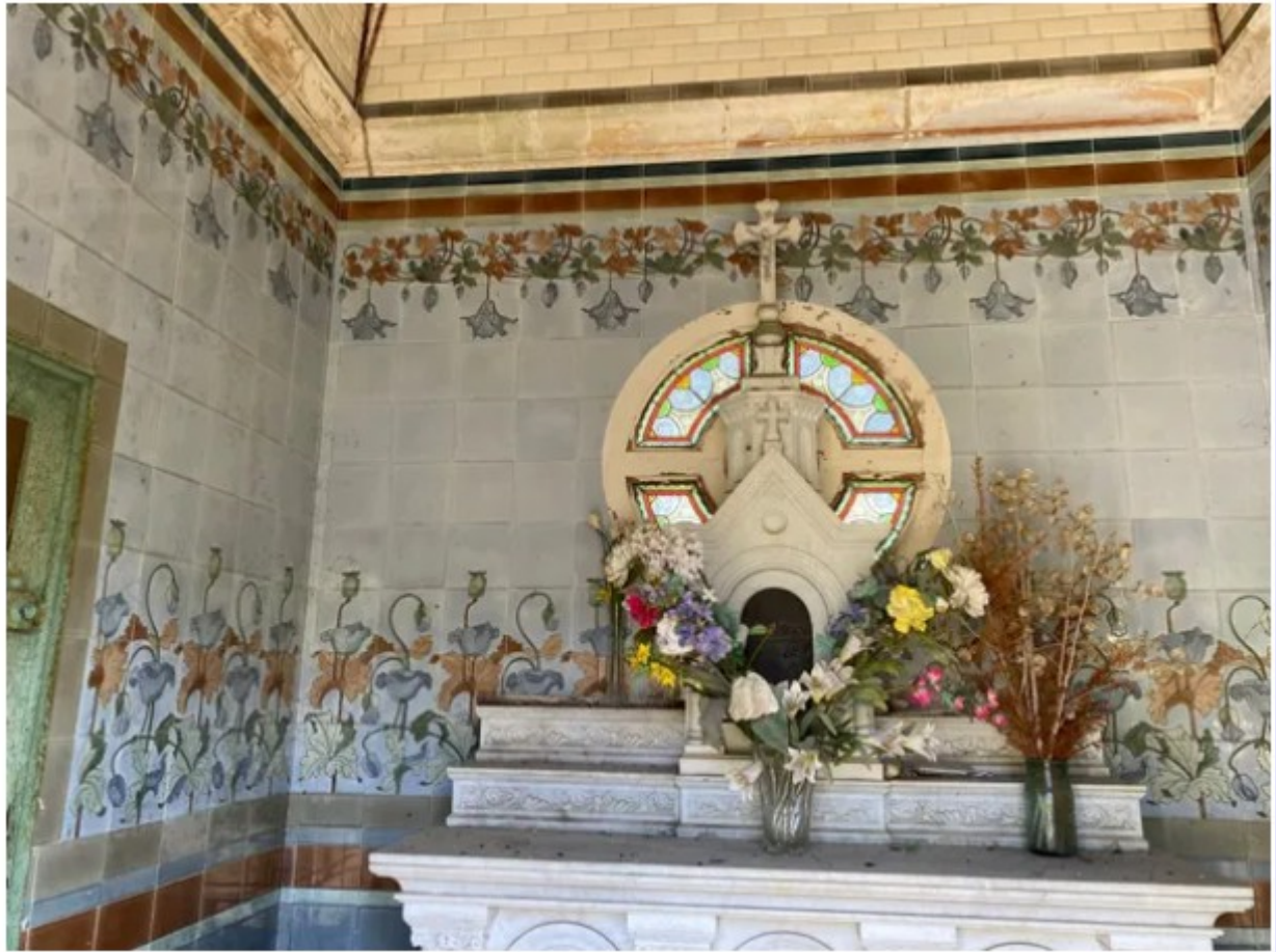
A l'intérieur de cette chapelle, des mosaïques Art déco.