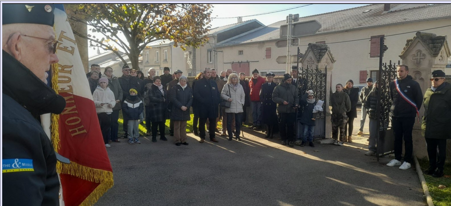
Quelques habitants étaient présents lors de l'inauguration Photo Dr inauguration Photo Dr