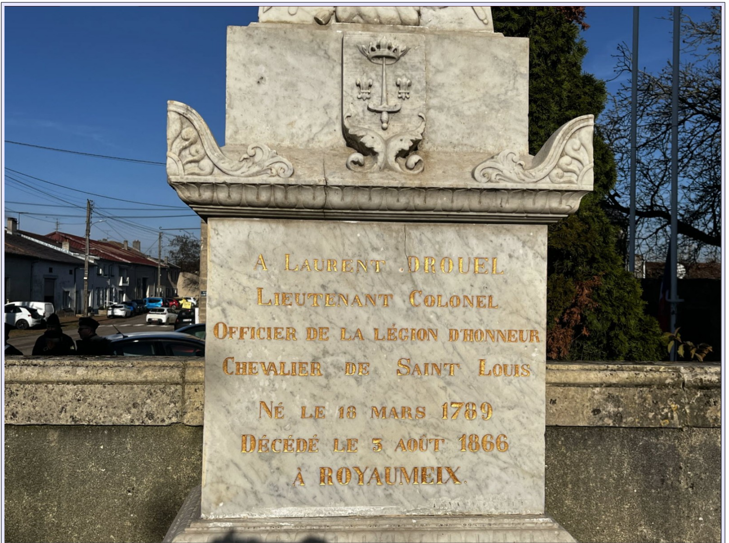
Les lettres refaites sur la stèle présents lors de l'inauguration