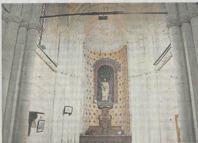
L'intérieur de la chapelle, qui a été désacralisée.