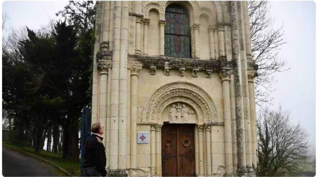
La chapelle Saint-Joseph, visible à l'entrée de la commune de La Chapelle-Largeau, a été répertoriée Monument historique.