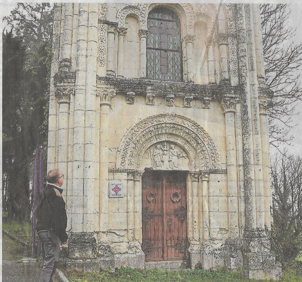
La chapelle Saint-Joseph, visible à l'entrée de la commune de La Chapelle-Largeau, a été répertoriée Monument historique.