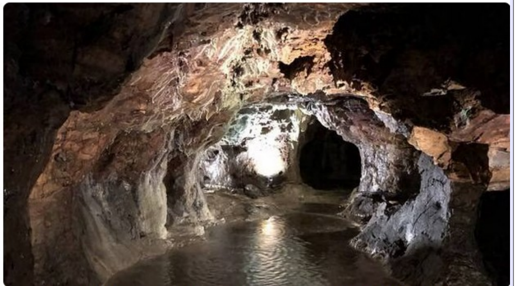
Les mines d'argent de Melle seront ouvertes jusqu'au 31 octobre 2026. | CO - MARIE-VALÉRIE JANNIN

Le site des mines d'argent de Melle rouvrira aux visiteurs samedi 11 avril 2026.